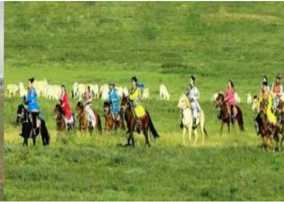
วันรุ่งขึ้น

ที่พัก กระโจมสไตล์มองโกลในอุทยานทุ่งหญ้า ระดับ 4 ดาว (ห้องน้ำในตัว) *ไม่มีห้องพักเสริมเตียง*